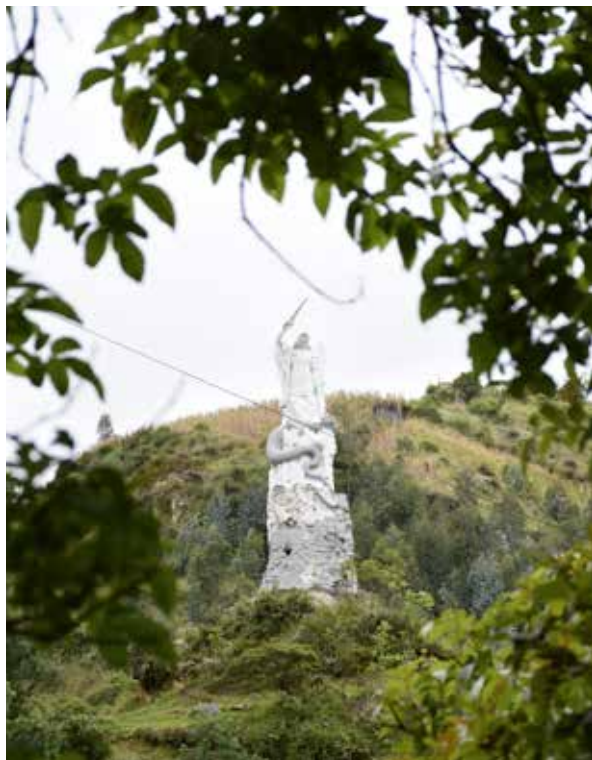
San Miguel Arcángel Custodio y Guardián del Santuario